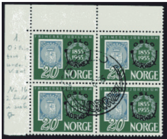
Eks. objekt 238