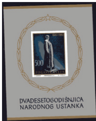
Eks. objekt 417