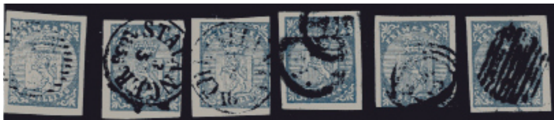
Objekt 1 til 6

..... Torsdag 10. oktober 2019, klokken 18.00