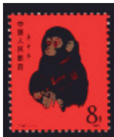
Eks. objekt 602